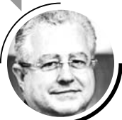
ЭММАНУЭЛЬ КИДЗ, ПРЕЗИДЕНТ ФРАНКО-РОССИЙСКОЙ ТОРГОВО-ПРОМЫШЛЕННОЙ ПАЛАТЫ