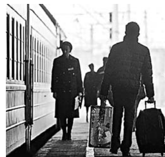
Люди боятся доверить багаж носильщику: а личные данные — Интернету.